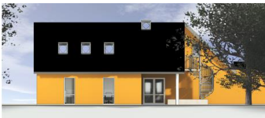
Facade mod vest. Fra ansøgningsmaterialet.