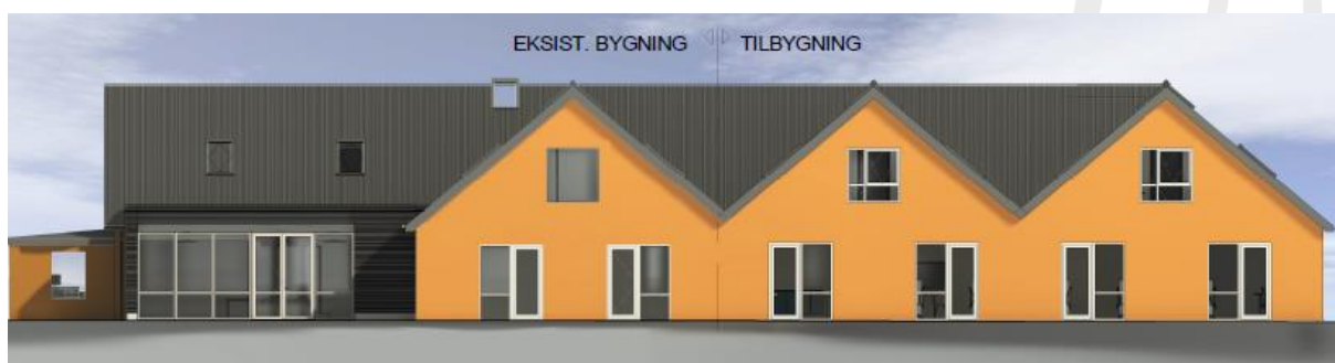
Facade mod nord. Fra ansøgningsmaterialet.