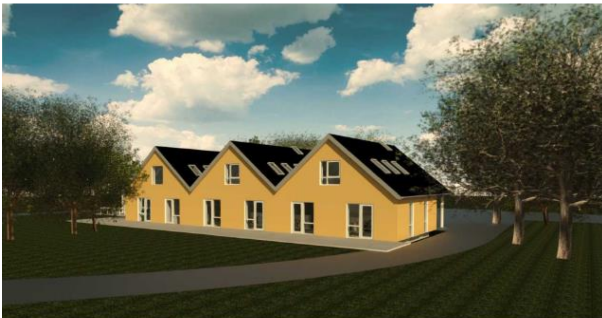
Den nye tilbygning set fra nordvest. Fra ansøgningsmaterialet.